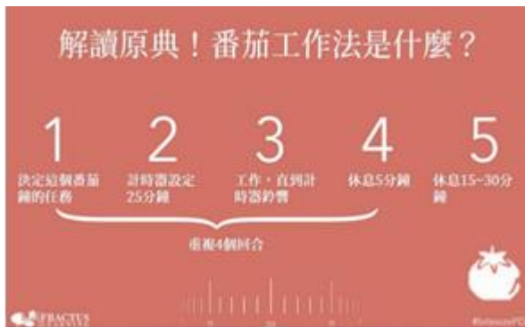
圖 4 番茄鐘工作法示意圖

存在狀態的負面情緒，理解歷史脈絡與權力迫害的流脈。蔣勳曾在《孤獨六講》靡費大量篇幅去揣摩暴力美學，闡釋藝術承載不可知的黑暗課題，係直接回應人性潛意識的欲求。 8 而縱使是暴漲災禍的世界以及倒臥屍身的血泊，背後的教化性仍綦大深遠。