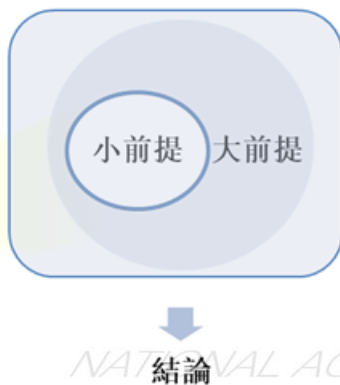
圖 3 三段論

學涵攝過程的基礎。 4 從原初的文法邏輯流變至網路的留言風向，雖然大抵可資解構言語的基質，但卻具有其兩面性，可謂一種奢侈的消耗品，釋放巨大的能量，也相對產生被後座力擊傷的可能。理性的公民訴諸三段論，自為己發聲袒護話語權，反之，惡意的政客假以操作三段論，利用演譯的偏狹，或者涉及歧視概念的偏差行為，容易使其淪為主從關係的一環，淪為共犯結構的內因。