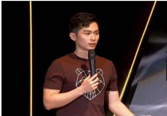
圖 5 網紅博恩表演脫口秀