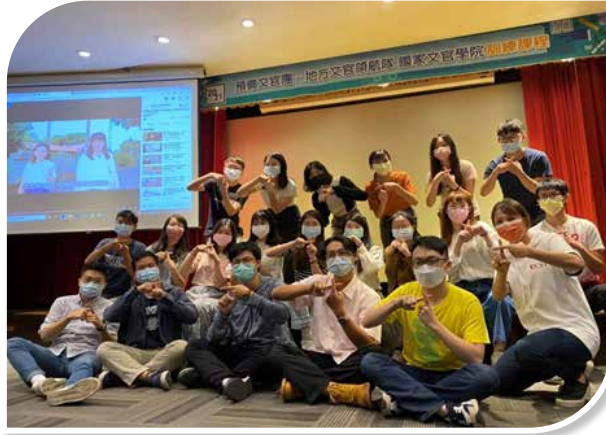
圖 4-5 地方文官領航隊訓練課程學員與講座合影