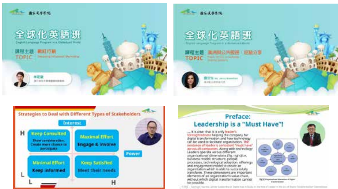
圖 5-3 全球化英語班線上課程影片

110 年全球化英語班於既有基礎力求精進，分 2 梯次辦理，每梯次 12 堂課、每堂課 1 小時為原則，政府機關不限職等之公務員均得報名，2 梯次共辦理 23 堂課程（第 1 梯次因受疫情影響取消 1 堂課），計有 998 人參加，其中 342 人通過評核並取得學習時數及證明。各梯次授課日期、講座及課程主題如表 5-2，參加人數、性別比率及學歷分布如表 5-3、5-4。