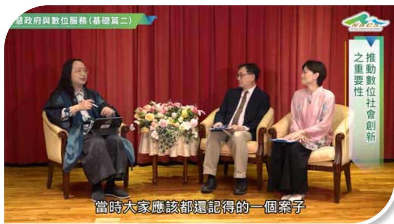
圖 6-3 「智慧政府與數位服務（基礎篇二）」數位課程剪影