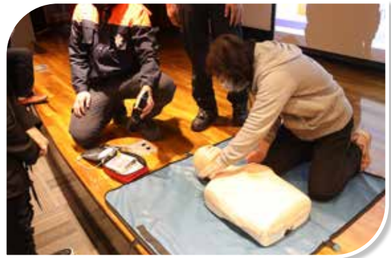
圖 5-5 自動體外心臟電擊去顫器 (AED) 實地演練

為落實宣導員工有關消防防護計畫之內容，並強化其防火防災觀念，藉由防災教育訓練之進行，以提升全體人員之防災常識及應變能力。110 年共辦理 2 次防災教育訓練，參訓人數總計 59 人（男 23 人，女 36 人），課程內容包含滅火、避難引導、安全防護、緊急通報、救護等個別演練及災害發生緊急應變綜合演練。訓練過程中，透過影片觀賞及實地演練，讓同仁瞭解防災因應作為，提升防災意識（如圖 5-5、5-6）。