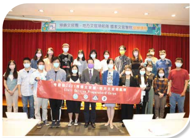
圖 4-4 地方文官領航隊訓練課程開訓合影

文官學院受考選部委託，於 110 年 8 月 26 日至 27 日辦理 2021「預備文官團－地方文官領航隊」訓練課程（如圖 4-4、4-5），內容包含領導力與國家考試、文官素養與公務基本知能、地方治理與地方政府服務經驗分享、創意思考與地方創生實例分享及公務生涯探索等議題，訓練人數 20 人（男 9 人，女 11 人）。