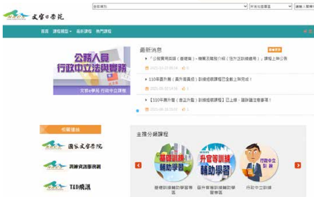
圖 6-1 「e 等公務園 + 學習平臺」「文官 e 學苑」加盟專區