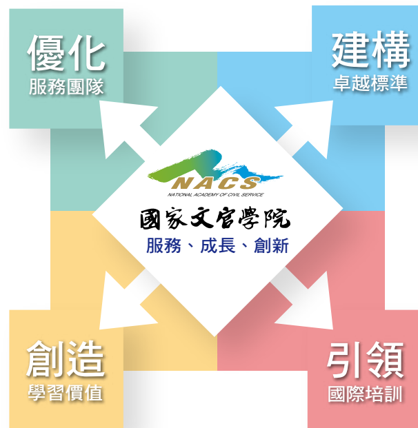
圖 1-1 四大執行策略與核心價值

文官學院以「樹立人才發展典範，創建文官培訓標竿（Stand for Excellence of HRD）」為發展願景，訂定「優化服務團隊」、「建構卓越標準」、「創造學習價值」及「引領國際培訓」等四大執行策略（如圖 1-1），本於「服務」、「成長」與「創新」的核心價值，秉持「積極前瞻」及「追求卓越」的精神，致力推展各項訓練業務。