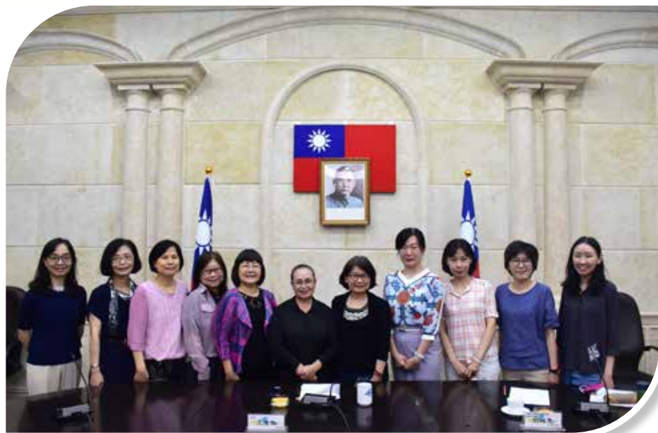
圖 3-7 各項法定訓練性別平等課程教材諮詢會議與會人員合影