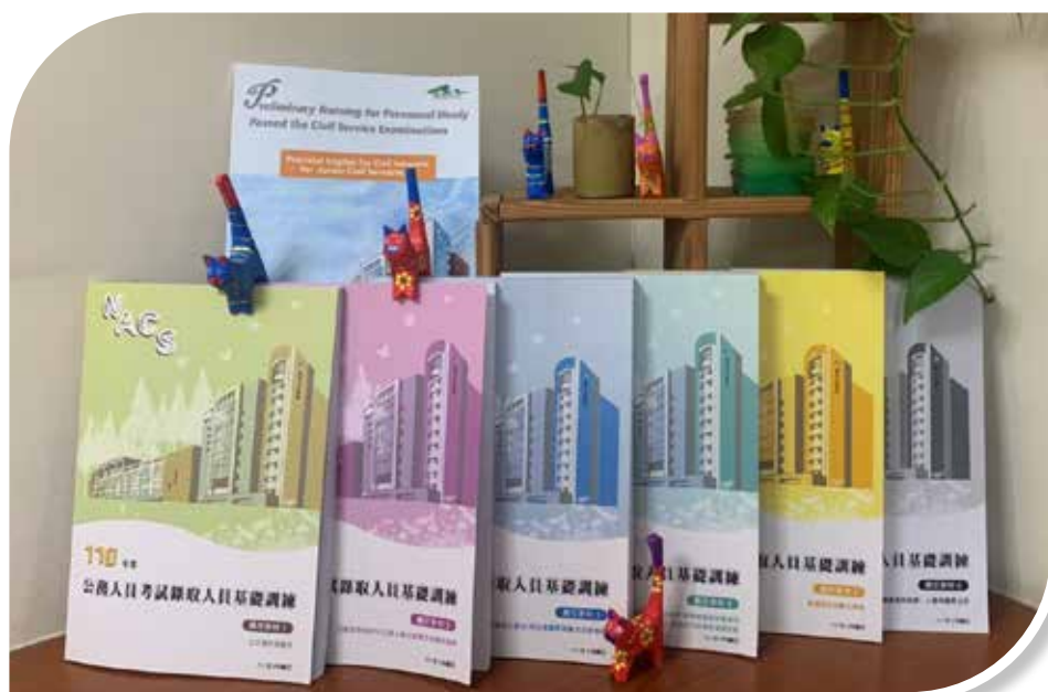
圖 3-8 各項法定訓練教材封面