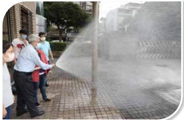
圖 5-6 室內消防栓實地演練