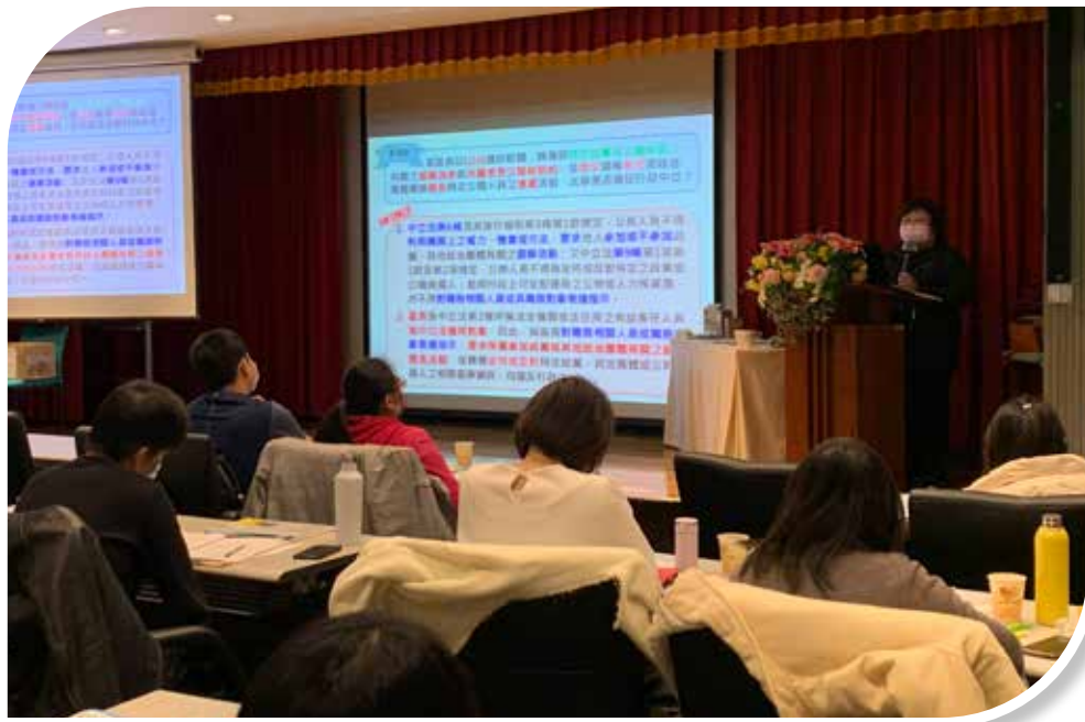
圖 3-10 呂司長秋慧講授行政中立相關規定

因應疫情，110 年行政中立宣導班縮減規模，12 月 14 日在文官學院辦理 1 班，敦聘銓敘部呂司長秋慧授課（如圖 3-10），計有 99 位人員參訓（男 38 人，女 61 人），比照實體課程防疫措施與標準，落實中央流行疫情指揮中心量測體溫、戴口罩及保持適當社交距離等防疫規範。