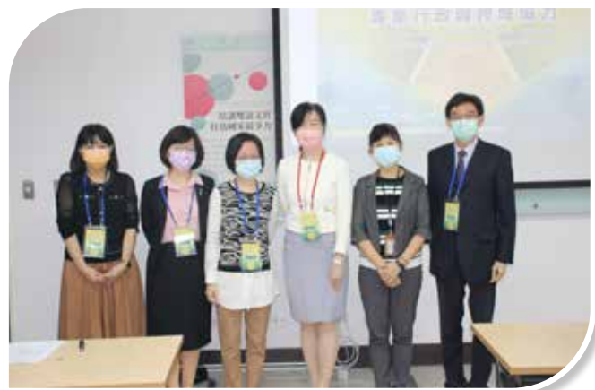
圖 4-3 2021 TASPAA 年會暨國際學術研討會自組場次與會人員合影留念