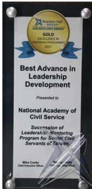
圖 4-6 BHG 人力資本管理卓越獎項領導發展類別金牌獎

110 年文官學院以「領導典範之傳承：臺灣高階公務人員職務見習方案」為題參與競賽，榮獲布蘭登·霍爾集團人力資本管理卓越獎項領導發展類別（Brandon Hall Group HCM Excellence Awards）金牌獎殊榮。（如圖 4-6）。