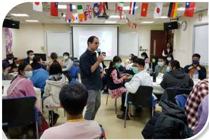
圖 3-5 英語會話角（English Corner）上課情形

精選公務英語每日一語，張貼於公共區域及透過文官學院培訓 App 推播；另擇定文官學院及所屬中區培訓中心試辦英語會話角（English Corner），佈置專屬場域、設計活動方式，並洽聘具豐富英語教學經驗之外籍講座，打造全英語學習環境，提升受訓人員英語表達力與溝通力，進而運用於實際公務場域中。（圖 3-5、3-6）