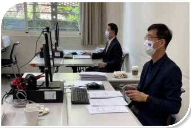
圖 3-3 升官等訓練專題研討線上答詢

因應專題研討個人答詢採線上答詢方式進行，爰規劃透過 Webex Meetings 虛擬教室，由評分講座提問後，依受訓人員口頭回答評分。為使受訓人員、評分講座及輔導員充分瞭解線上專題研討進行方式，爰擬訂線上答詢程序表及專題研討線上實施方式說明等資料，並據以執行，以確保成績評量過程之一致性。另於專題研討前，安排受訓人員進行專題研討線上答詢演練 2 次，以熟悉系統操作及流程（如圖 3-3）。