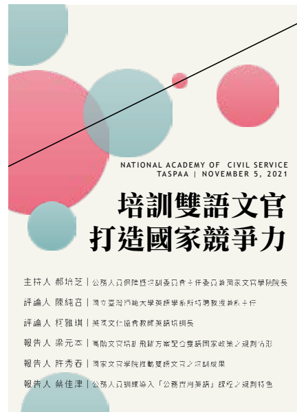
圖 4-2 2021TASPAA 年會暨國際學術研討會自組場次海報

2021 TASPAA 年會暨研討會於 110 年 11 月 5 日於中央警察大學舉行，為促進學術研究與實務工作經驗交流，以及呈現文官學院培訓成果與蓄積研究能量，文官學院以「培訓雙語文官打造國家競爭力」為主題，發表「高階文官培訓飛躍方案配合雙語國家政策之規劃情形」、「國家文官學院推動雙語文官之培訓成果」及「公務人員訓練導入『公務實用英語』課程之規劃特色」等報告，並邀請國立臺灣師範大學英語學系陳主任純音及英國文化協會教師柯英語培訓長雅琪進行評論，並同與會之學者及實務工作者進行對話交流（如圖 4-2、4-3）。