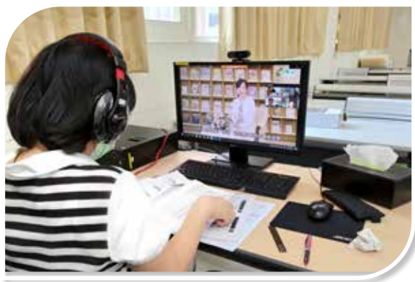
圖 3-1 升官等訓練輔導員播放主委開訓致詞影片

為增加受訓人員與講座互動交流及個案研討機會，爰擇定薦升簡及正升監訓練「團隊領導與部屬培力」等 6 科，委升薦及員升高員訓練「方案規劃」等 3 科，實施線上直播授課，講座並可運用 Webex Meetings 虛擬教室特有之分組討論功能，將受訓人員分組，於各組研討時進行小組指導（如圖 3-1）。