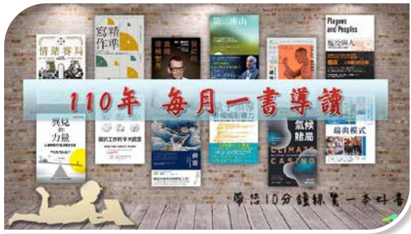
圖 5-1 「每月一書」介紹短片課程

為將導讀會活動效益擴大推廣至全國各機關，文官學院原訂與中央及各縣（市）政府，合作辦理 45 場次全國分區導讀會，惟受 COVID-19 疫情影響，實際僅執行 12 場次，共有 1,008 人參加。為因應疫情，110 年度另錄製「每月一書」介紹短片（如圖 5-1），及兩大領域票選人氣圖書《情緒賽局》及《異見的力量》之線上導讀課程，放置於「文官 e 學苑」數位學習加盟專區，提供公務人員選讀。