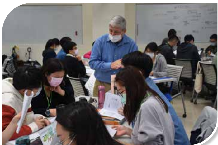
圖 3-6 講座引導學員開口說英文