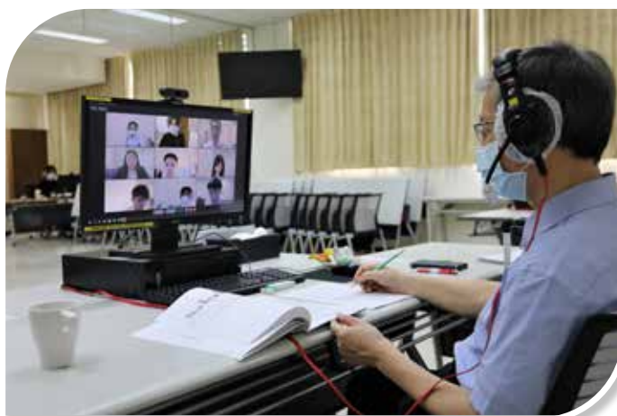
圖 3-4 講座主持線上專題研討情形

因應線上學習新型態，創新規劃線上專題研討評量機制及紙筆測驗實施方式與配套措施。專題研討改以線上方式進行，從使用者角度，編製講座、受訓人員及輔導員標準作業程序、應行注意事項及圖像式操作手冊，並以多元管道進行宣導，以確保線上專題研討順利舉行。紙筆測驗則改採 Take-Home Exam 方式，受訓人員在規定時間內運用課程習得之知識進行作答，並上傳至新開發之評量作業系統，以評量學習成效。(圖 3-4)