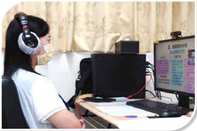
圖 3-2 升官等訓練輔導員進行班務活動

依據線上學習方式擬具排課原則、講座授課說明、課表參考模版，並為使輔導員瞭解居家線上學習之訓練作法、課程進行方式及成績評量等事項，除辦理輔導員線上講習外，於訓前第 1 週及訓中第 1 週至第 3 週，每週召開輔導員工作會議，提醒每週工作重點及注意事項。又為使受訓人員適應虛擬教室運作，迅速提升數位資訊能力，製作 Webex Meetings 系統操作說明影片及簡報，以協助受訓人員熟悉如何登入直播課程虛擬教室、舉手發言、回應、使用聊天室等系統功能（如圖 3-2）。