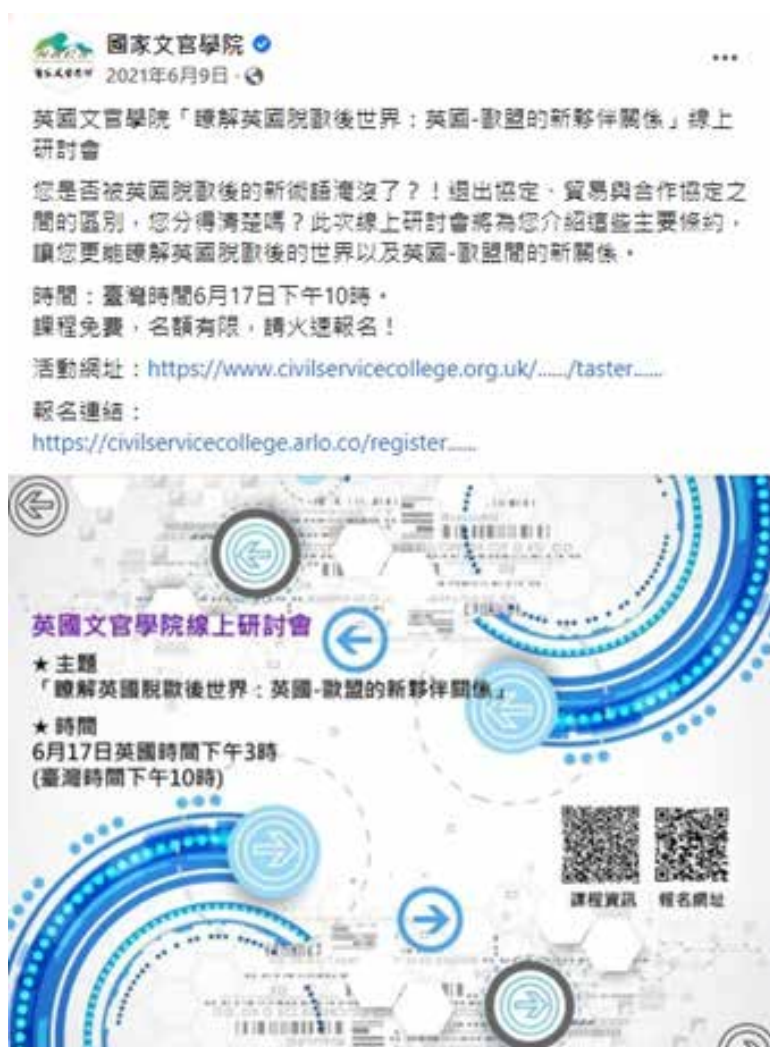
圖 4-1 線上研討會－臉書粉絲專頁宣傳畫面

為強化與國外 MOU 培訓機關（構）之交流合作，並提供我國公務人員多元學習管道，增進公務人員與國際接軌能力，文官學院協洽簽訂 MOU 之各國培訓機關（構）提供相關學習資源，並即時更新於臉書粉絲專頁（如圖 4-1），110 年英國文官學院（CSC）提供線上研討會，計 11 門課程。