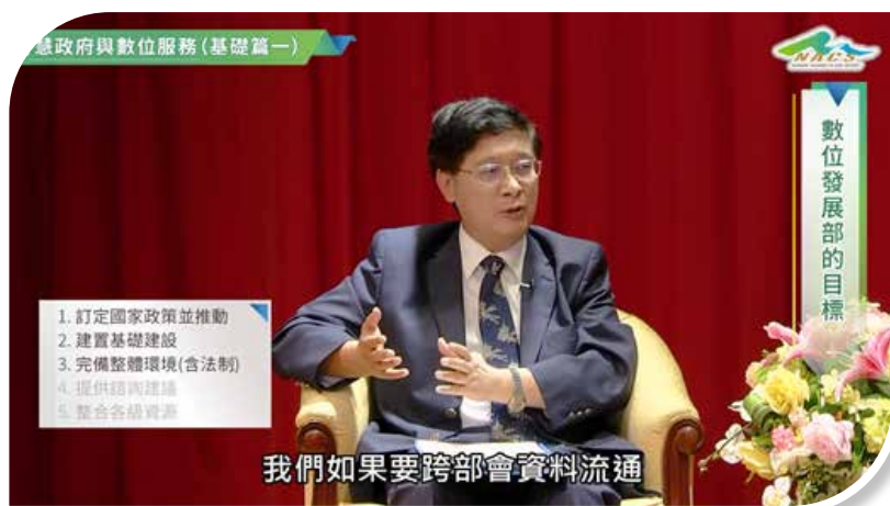
圖 6-2 「智慧政府與數位服務（基礎篇一）」數位課程剪影

為建構公務人員對政府數位治理之整體性認識與瞭解，提升數位素養與服務效能，文官學院邀請國立政治大學公共行政學系陳教授敦源及朱特聘教授斌好兼臺灣數位治理研究中心主任，共同訪問行政院郭政務委員耀煌及唐政務委員鳳，製作「智慧政府與數位服務（基礎篇一、二）」數位課程，並將數位課程剪輯成 20 部主題微學習影片，以提供受訓人員更多元彈性的學習方式（如圖 6-2、6-3）。