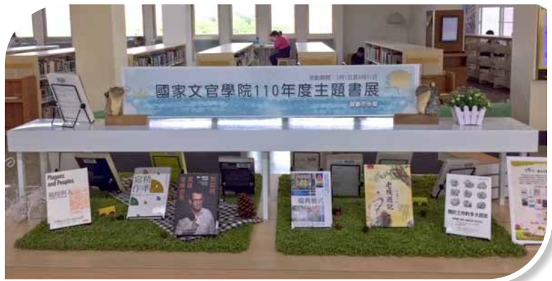
圖 5-2 臺南市立圖書館（北區舊總館）主題書展海報

為向國人推廣專書，與考試院圖書館、新北市立圖書館、新竹市文化局圖書館、國立公共資訊圖書館、南投縣政府文化局圖書館、臺南市立圖書館（北區舊總館）、雲林縣政府文化觀光處圖書館、高雄市立空中大學圖書館、臺東縣政府文化處圖書館、連江縣政府文化處馬祖圖書館、澎湖縣圖書館及金門縣立圖書館進行館際合作，含括北、中、南、東及離島之 12 家代表性圖書館，成立主題書展專區（如圖 5-2），展出「每月一書」、「年度推薦經典」等圖書。