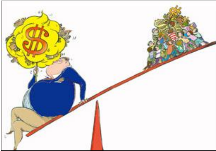
圖 1 貧富差距大！1%與 99%的戰爭