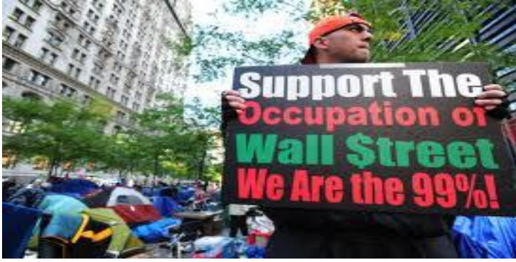
圖 2 貧富差距已經是全世界共同的問題