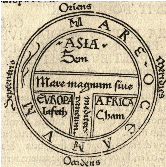
圖 2 1472 年奧格斯堡的 Guntherus Ziner 所繪的 TO 地圖，顯示出在航海術及測量技術尚未完善前，地圖繪製常出現比例上及整體分布的錯誤，並常表現出繪圖者本身的主觀意識。

然而在很多時候，文化並沒有「對」與「錯」之分，它們之所以擁有各種面貌，是因為它們來自不同的史地社經，不同的時空背景，而不是誰「高尚」，誰「卑微」。