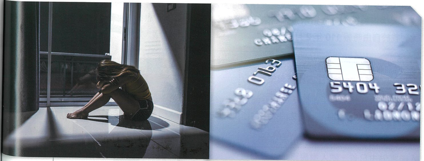
楊某在網路上對正妹散布每月 30 萬元之包養訊息，要求女方讓他先「試車」；多位女子不但被騙失身，甚至被騙走財物。（本圖為示意圖，非受害當事人）

詐騙集團為隱匿身分，通常收集他人帳戶當作犯案工具，這些被拿來當作犯罪工具帳戶，即「人頭帳戶」，在〈刑法〉上會構成詐欺罪的幫助犯，即使不知情，但未善盡查證之責，也應負過失責任。