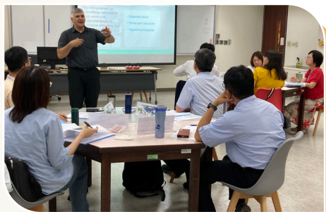
全球移動力英語課程