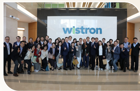
緯創資通移地學習