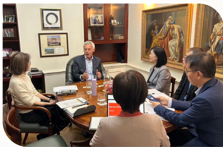
與國外高階官員交流與討論