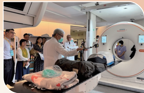
參訪重粒子癌症治療中心