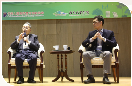
大師學堂-施振榮董事長及施宣輝董事長