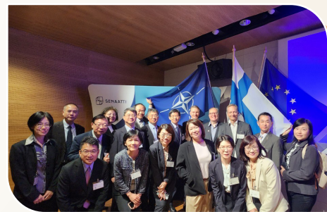
國外研習參訪重要機關