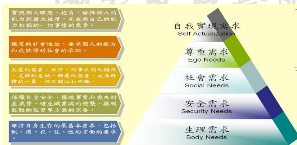
圖 5 Maslow 需求層次理論圖

當公務員很好嗎？為什麼很多人擠破頭考公務員？美國猶太裔心理學家亞伯拉罕·馬斯洛需求層次（如圖 5）理論闡明，公務員屬於人類的最上層心理需求的自我實現，當個體在適宜的社會環境中得以充分發揮能力，驅使自我實現個人理想和抱負，也就是說，人必須做稱職的工作，才能滿足高層次需要，這樣才會使他們感到最大的快樂，使自己成為自己所期待的人物。