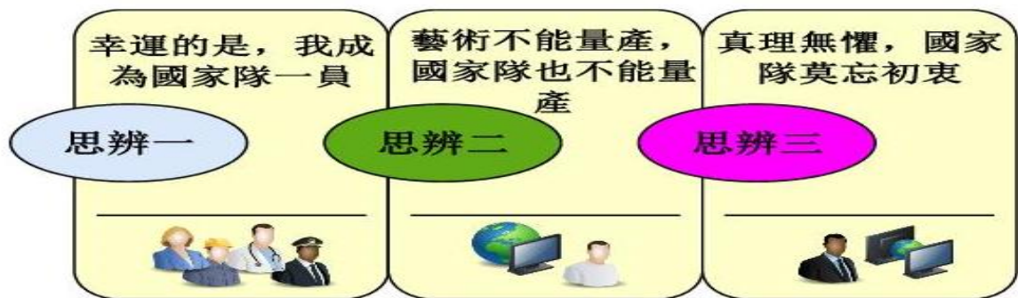
圖 4 思辨圖

身為臺灣最大公司—政府的員工，同時肩負臺灣兩千多萬納稅人的共同期待，我們是否有思考如何妥善運用國家資源？還是不明就裡完成長官及民代的交代？這些反思不是要對公務體系絕望，反而是因為愛之深責之切的期待，希望公務員雙肩承擔社會人民重任下，思考不集體盲從，都有尋回最初的勇氣，擁有讓臺灣 2000 萬人民感受到國家的幸福溫度的能力，真理無懼，莫忘初衷，臺灣會走出不同的路。