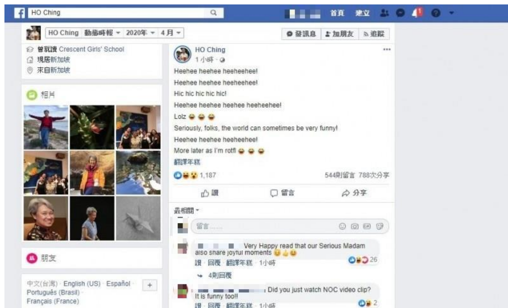
圖1 何晶臉書謎樣「嘻嘻」貼文